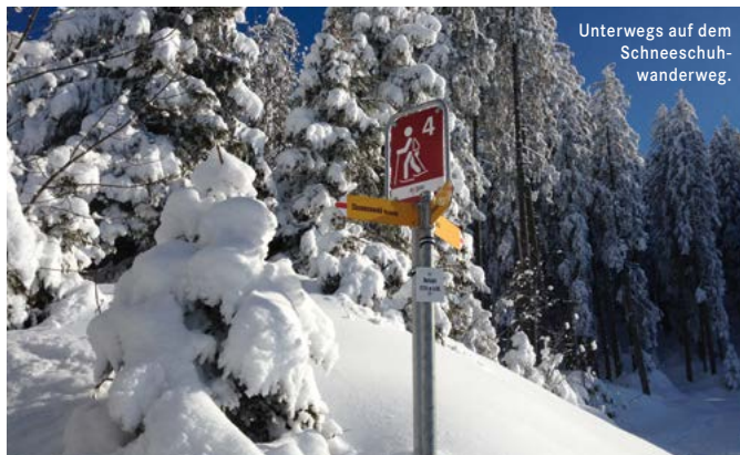
Unterwegs auf dem Schneeschuhwanderweg.

Die Routen sind nicht beschildert, nicht gesichert und nicht immer präpariert. Bitte Signalisation des Pistenunterhalts beachten.